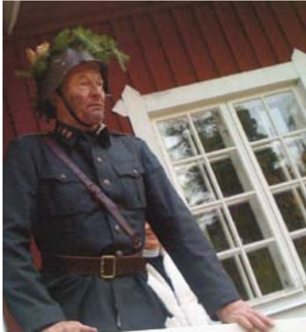
Kapteeni lähettää joukkonsa matkaan