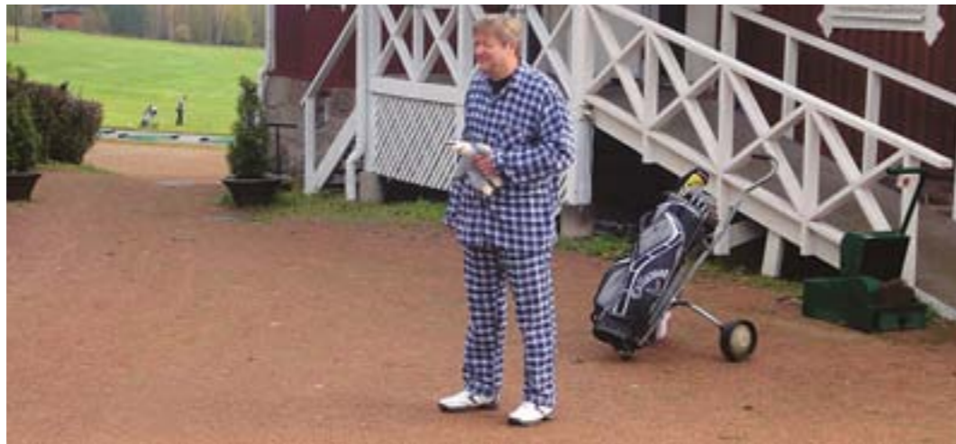
Aina näin aikaisin