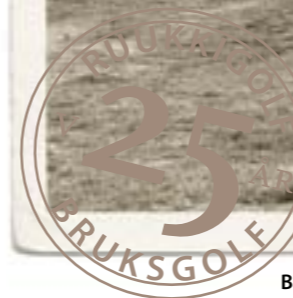
Banans invigning 7.8.1988