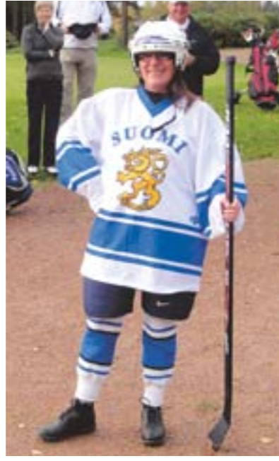
Kaikki aselajit mukaan