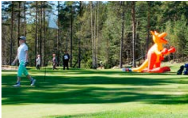
Ruukkijunnujen aktiivisesta toiminnasta sivulla 20–21