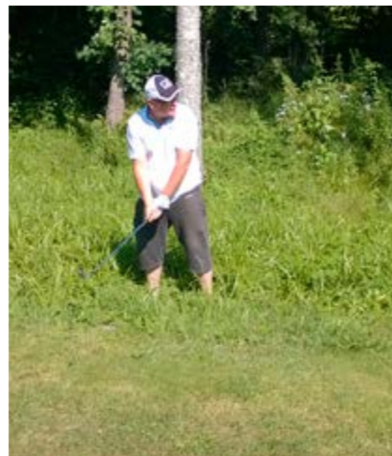
Kuva 2. "Sinne se meni siitä kellon kohdalta."

30-vuotisen historian aikana n. 100 000 palloa. Jos nuo pallot laitettaisiin jonoon, se ulottuisi klubitalolta Pohjan S-Marketin parkkipaikalle. On siinä muutama pallo uinut.