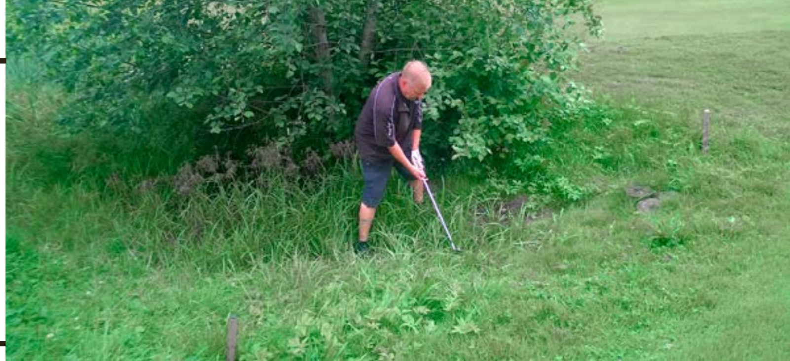
Kuva 3. "Kyllä se siitä lähtee" -lausahdus enteilee yleensä lisävaikeuksia.