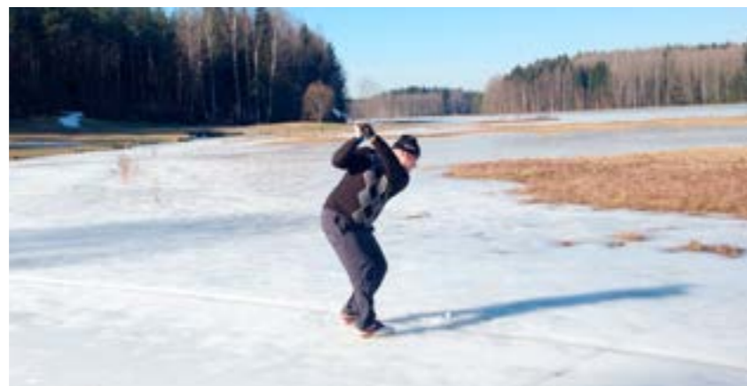
Kuva 1. Nelosväylän vesikammo kannattaa selättää jo keväällä.

Nelosväylän oikealla puolella oleva Torrsjö jää mieleen heti ensimmäisestä pelikerrasta. Yleensä, kun on jutulla Ruukki-golfissa vierailleiden kanssa, melko nopeasti tulee puheeksi se nätti väylä, jossa on vesi koko ajan oikealla puolella. Nelonen onkin Ruukin selkeä nimikkovesiväylä.