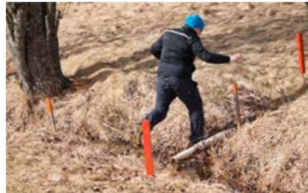
Vieraskynämme Edu Arvonen käy läpi tällä kertaa Ruukin vesiesteet sivuilla 30–31