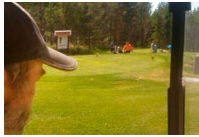
Vi träffas den legendariska banskötaren på sidan 24 Tapaamme Ruukin legendaarisen kentänhoitajan sivulla 25