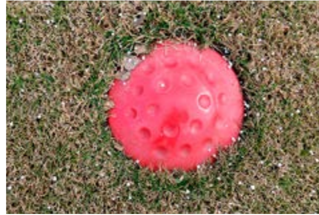
Kevät on ollut kolea, mutta kenttötoimikunnalla on taatusti monia pelaajia lämmittäviä uutisia sivulla 23