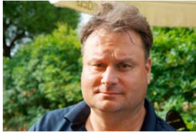
Ruukki Golf ry on saanut uuden puheenjohtajan. Haastattelu sivulla 4