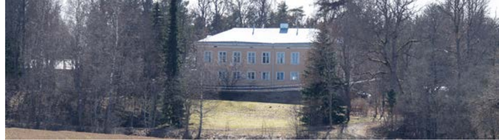
Kartano näkyy hyvin väylälle 15

– Kentän nimeäkin mietittiin paljon. Brödtorpia pidettiin liian vaikeana vaihtoehtona ja lopulta päädyimme Ruukki/Bruk -vaihtoehtoon, koska nimien