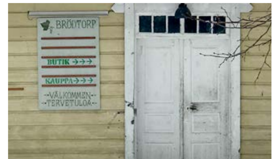
Brödtorps butik är öppen dagligen