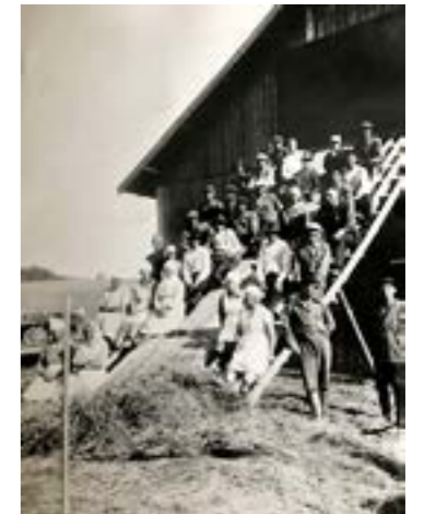
Kartanon työväkeä 1930-luvun loppupuolelta